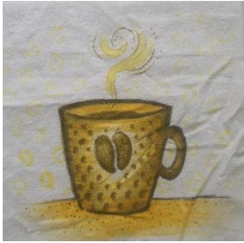
Olga Hopf Familientreff Süd Osnabrück