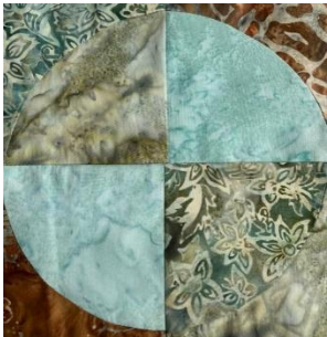
Patchworkerinnen vom Gemeinschaftszentrum Lerchenstraße Osnabrück