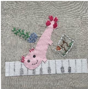
Tessa 9 Jahre Osnabrück