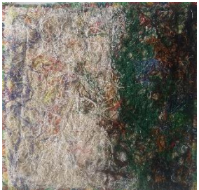
Ute Bögner Osnabrück

Vor ca. 12 Jahren genäht, nicht ganz gelungen, aber der Anfang für ein Hobby, das mir bis heute viel Freude bereitet und mich glücklich macht.