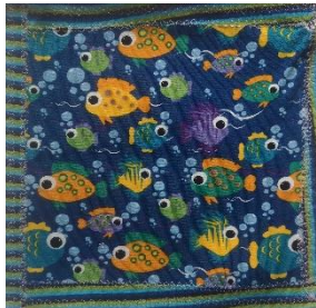
Ute Bögner Osnabrück