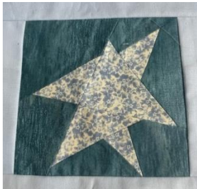
Patchworkerinnen vom Gemeinschaftszentrum Lerchenstraße Osnabrück