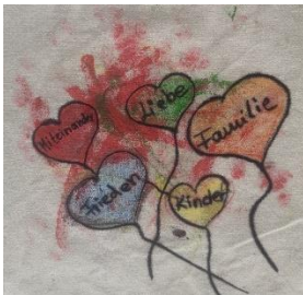
Zara Familientreff Süd Osnabrück

Mein Quadrat macht mich glücklich, weil es für mich das Leben ausdrückt – wo komme ich her, wo gehe ich hin