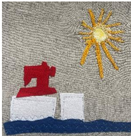
Ida 8 Jahre Osnabrück