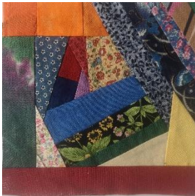
Ute Bögner Osnabrück

Vor ca. 12 Jahren genäht, nicht ganz gelungen, aber der Anfang für ein Hobby, das mir bis heute viel Freude bereitet und mich glücklich macht.