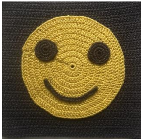
Nachbarschaftshilfe Dodesheide-Haste- Sonnenhügel e.V. im Gemeinschaftszentrum Lerchenstraße Osnabrück