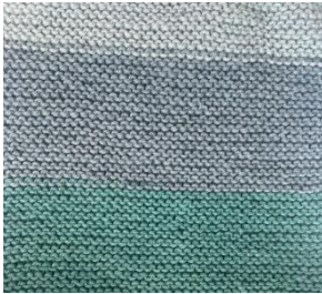
Nachbarschaftshilfe Dodesheide-Haste- Sonnenhügel e.V. im Gemeinschaftszentrum Lerchenstraße Osnabrück