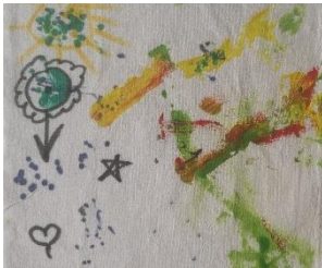
Familientreff Süd Osnabrück