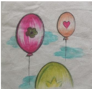
Olga Hopf Osnabrück