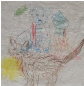
Familientreff Süd Osnabrück