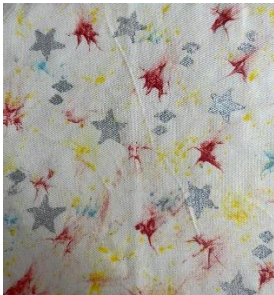
Ida Linnenkämper Universität Osnabrück

Ich habe mich dazu entschieden, einen Sternenhimmel darzustellen, da es mich glücklich macht, in einer Sommernacht in den Himmel zu blicken und die Sterne und Sternschnuppen zu beobachten.