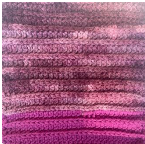
Nachbarschaftshilfe Dodesheide-Haste- Sonnenhügel e.V. im Gemeinschaftszentrum Lerchenstraße Osnabrück