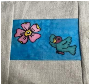
Patchworkerinnen vom Gemeinschaftszentrum Lerchenstraße Osnabrück